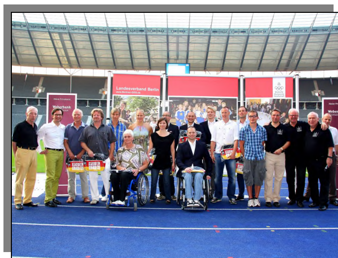
Die Berliner Teilnehmer an den Paralympics wurden mit den besten Wünschen nach London verabschiedet.

Mit mehr als 400 Gästen aus Sport, Politik und Wirtschaft haben wir am 27. Juli unser Sommerfest 2012 im Berliner Olympiastadion gefeiert. Am Tag der Olympia-Eröffnung in London standen die Olympischen und Paralympischen Sommerspiele 2012 im Mittelpunkt. Veranstaltungspartner waren der Landessportbund Berlin, der Behinderten-Sportverband Berlin sowie die TOP Sportmarketing Berlin GmbH und das Olympiastadion. Präsentiert wurde das Sommerfest von der Weberbank Actiengesellschaft.