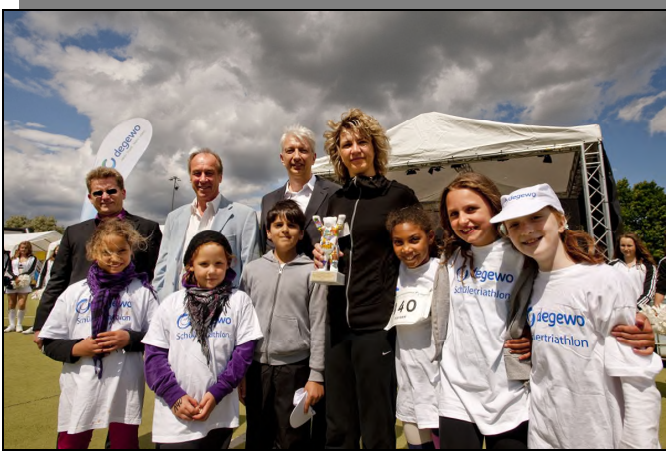
Die Zürich-Grundschule aus Berlin-Neukölln wurde mit dem DOG-Fair-Play-Preis ausgezeichnet.

Am 6. degewo-Schülertriathlon 2012 nahmen über 1100 Schülerinnen und Schüler aus den Neuköllner Schulen teil – so viele wie noch nie. Die DOG Berlin ist mit der Übergabe des Fair-Play-Preises fester Bestandteil des Neuköllner Schülertriathlons.